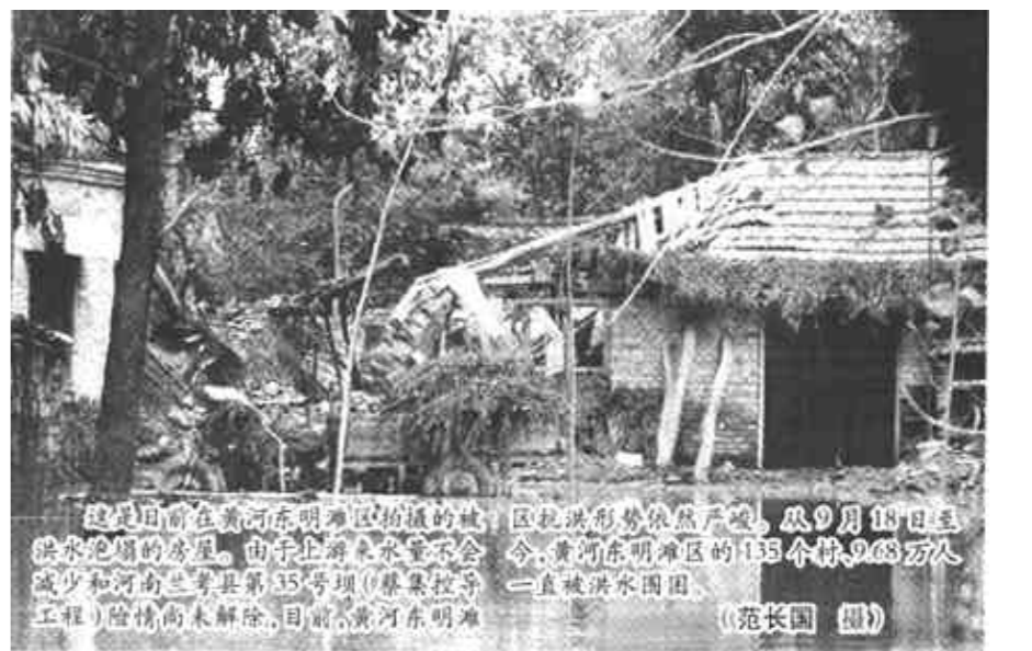
这是目前在黄河滩区被围困的村庄。由于上游来水猛增，黄河滩区133个村庄的灾民，被洪水围困。目前，黄河滩区灾民安置工作尚未结束，目前黄河滩区灾民安置工作尚未结束。