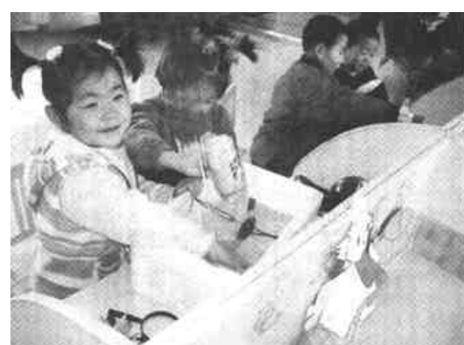
利津县第二实验小学幼儿园承担了山东省十五重点规划课题“科技(学)教育活动发现室”，他们在教学中将科学的自然生态观和科技观渗透在科学教育中，激发孩子们的好奇心和创新意识。图为幼儿在科学发现室探究“快乐的小水车”原理。

里等候理发的人特别多。为了尽快给老人理发，他向等候理发的人征求意见说：“请大伙稍等一等，我先给这位老大爷理一理好吗？”当大伙点头同意，王成太拿起推子正准备给老人理发时，老人坚持要用剃头刀剃头。王成太满口答应，马上给老人洗头洗脸，然后熟练地给老人剃头刮胡子，直把老人打扮得干干净净、轻轻松松。老人临出门，从上衣口袋里摸出一沓一角一张的人民币纸票往王成太手里塞。王成太连忙把纸票装进老人衣袋。 王成太不嫌脏不怕麻烦义务为老人理发的做法，受到在场顾客的啧啧称赞。 (刘克明 李波)