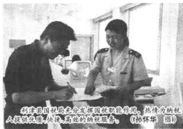
胜利县国税局充分发挥国税职能作用，热情为纳税人提供快捷、高效的纳税服务。

市国税局12366纳税服务热线作为国税部门服务纳税人、服务社会的“纳税服务中心”受到全社会广泛欢迎。